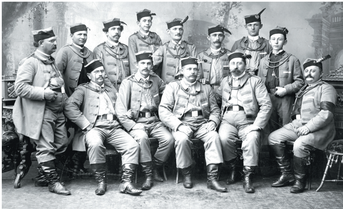
Zarząd Towarzystwa Gimnastycznego „Sokół” we Wrześni, k. XIX w.

W 1794 r. kiedy Prusacy zajmowali Wrześnię, działały tu 3 gospody. W 1858 r. nadal działały 3 gospody, ponadto było 5 wyszynek (czyli pijalni) i 8 jadłodajni. Natomiast już dziesięć lat później było 36 wyszyn-