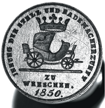
Tłok pieczętny Cechu Stelmachów i Kolodziej we Wrześni, 1850 r., ze zbiorów Muzeum Regionalnego we Wrześni

Wiek XIX był wyjątkowym okresem dla rozwoju wrzesińskiego rzemiosła. Dotychczas w profesjach przeważali szewcy, garncarze czy kowale, żydowscy krawcy lub czapnicy oraz niemieccy piekarze i powoźnicy. Po zniesieniu przymusu cechowego w 1833 r. rozwinęły się nowe samodzielne zawody rzemieślnicze. Wzrosła liczba zawodów czy zakładów związanych z przetwórstwem spożywczym. We Wrześni powstały nowe młyny wietrzne (w 1858 r. funkcjonowało 12 wiatraków), w 1839 r. obok dotychczasowego browaru powstała destylarnia